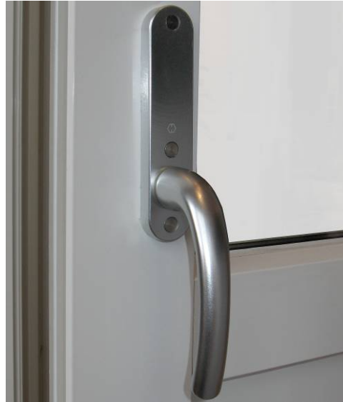
Kuvassa HOPPE KL300-sarjan painike

Tavanomaisin pitkäsulkijalla varustetun parveke-/terassioven painikeratkaisu ulkopuolella on nk. sokeakilpinen painike ja sisäpuolella vääntönupillinen painike, jolloin ovi voidaan sulkea, muttei lukita ulkopuolen painikkeesta.